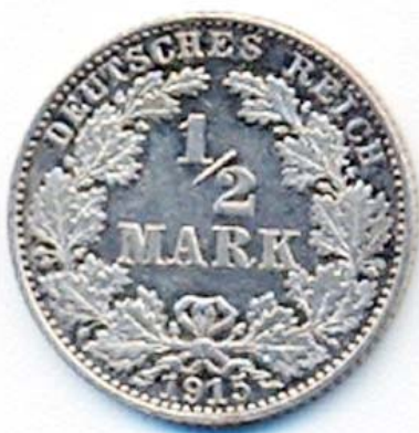
Eine halbe Mark von 1915

konnte, wozu noch die Ausgabe von Brotkarten die Jedem zukommende Brotmenge regelte.