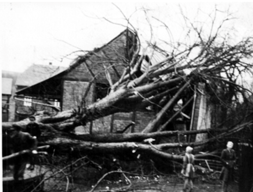
Aufräumarbeiten: Die Beseitigung der umgestürzten Linde, um die damals Hauptdurchgangsstraße wieder befahrbar zu machen.