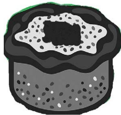
Käsekuchen mit 'Aussparung'.

Kuchens ein Viereck hineingeschnitten und ist dann mittags mit ihrem „fallierte Kuche“ losgezogen. Die anderen Frauen staunten nicht schlecht. „Ei, woas ess dass doa fiern Kuche mit dem Vejereck enn de Mitt“. Darauf meine Mutter: „Ja, dass ess de Landratskuche!“ Da konnte er ja sein Wappen hineinstellen. Der Kuchen war ruck zuck leergegessen, es war halt ein besonderer Kuchen und er hat allen gut geschmeckt.