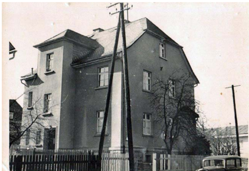
Die erste Praxis in der heutigen Beilsteiner Straße 17, davor sein Auto